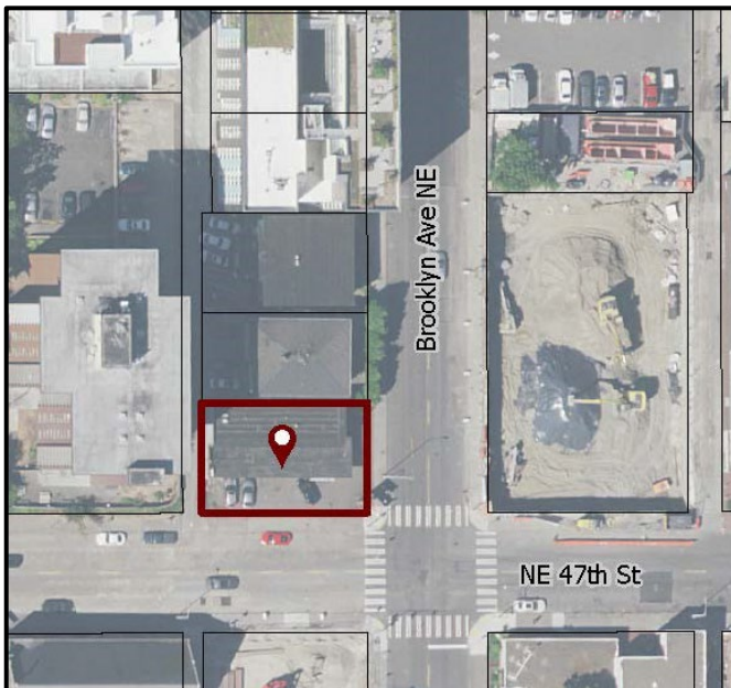
Carson Cleaners 站點的位置