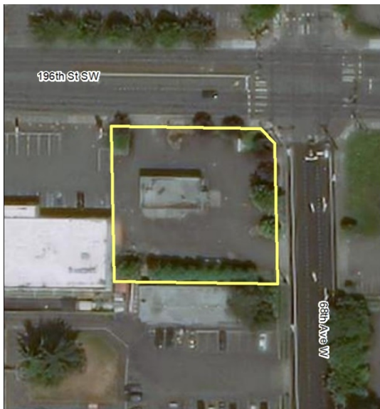
Vista aérea del Sitio Texaco Strickland