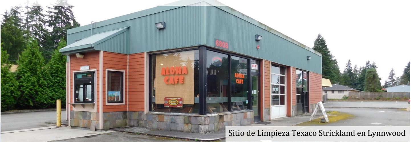
Sitio de Limpieza Texaco Strickland en Lynnwood

Se aceptarán comentarios: 6 de julio al 4 de agosto del 2021 Envíe sus comentarios En línea a: