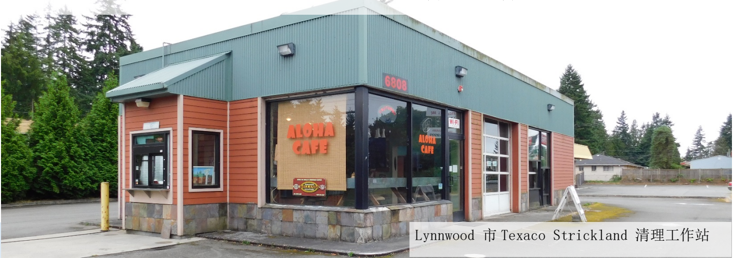
Lynnwood 市 Texaco Strickland 清理工作站