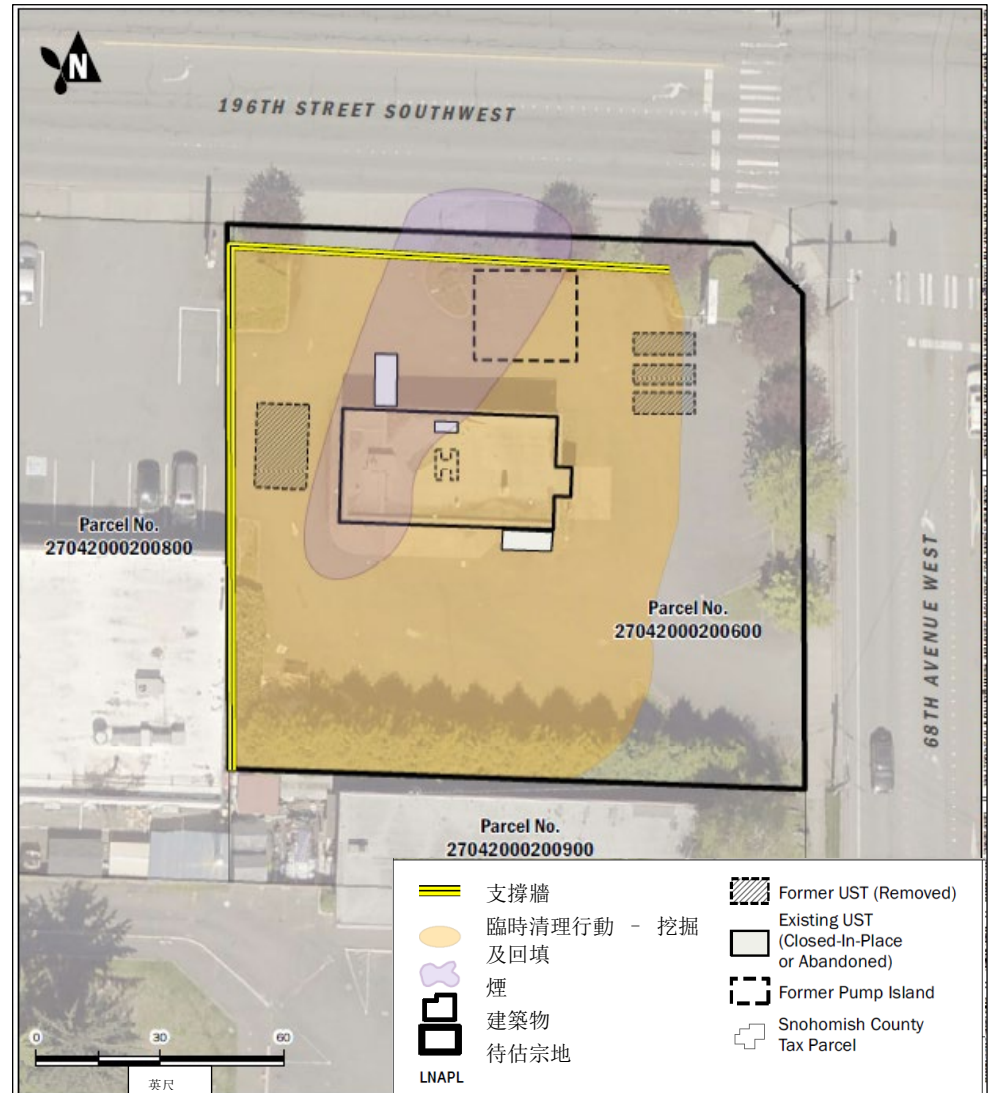
Texaco Strickland 工作站俯視圖。污染範圍及修復規劃如上所示。

SEPA（本州環境政策法）要求考慮項目環境影響。生態署評估臨時清理行動工作計劃書中所述的項目工作，判定該工作不會對環境造成明顯不利影響。