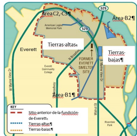
Mapa del proyecto de limpieza de la fundición de Everett. La planificación de las acciones de limpieza en las Áreas B1, B2, C2 y C3 comienza este año.