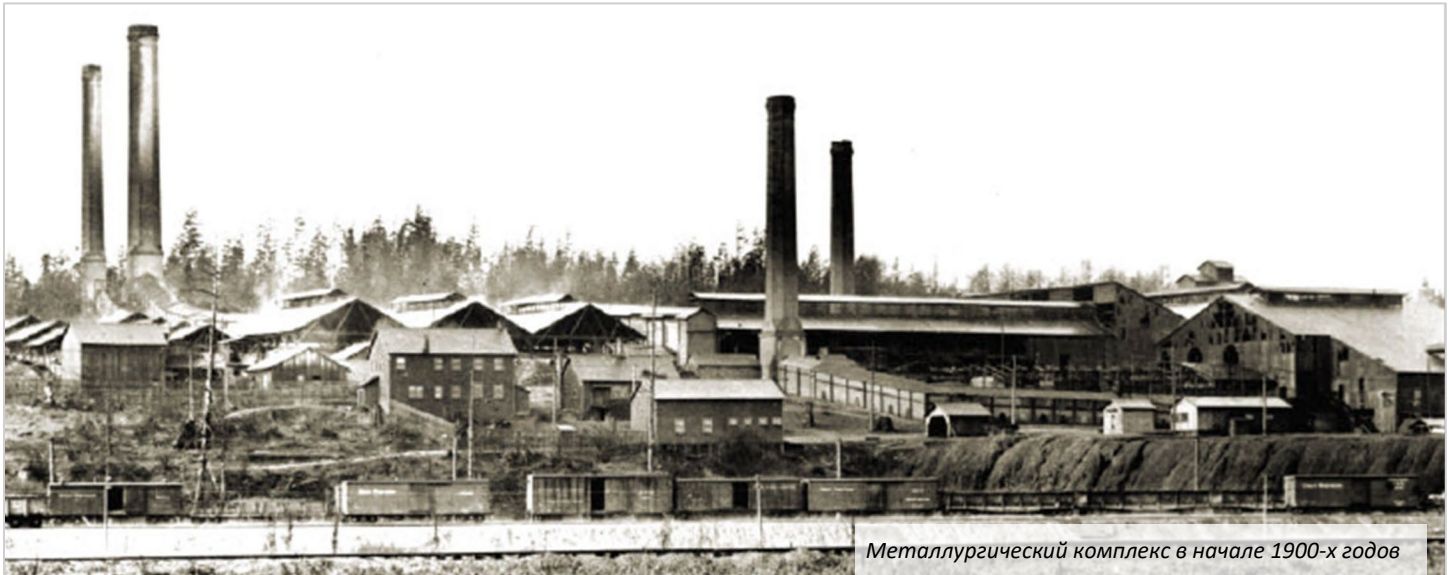
Металлургический комплекс в начале 1900-х годов

Горячая линия металлургического комплекса Everett: