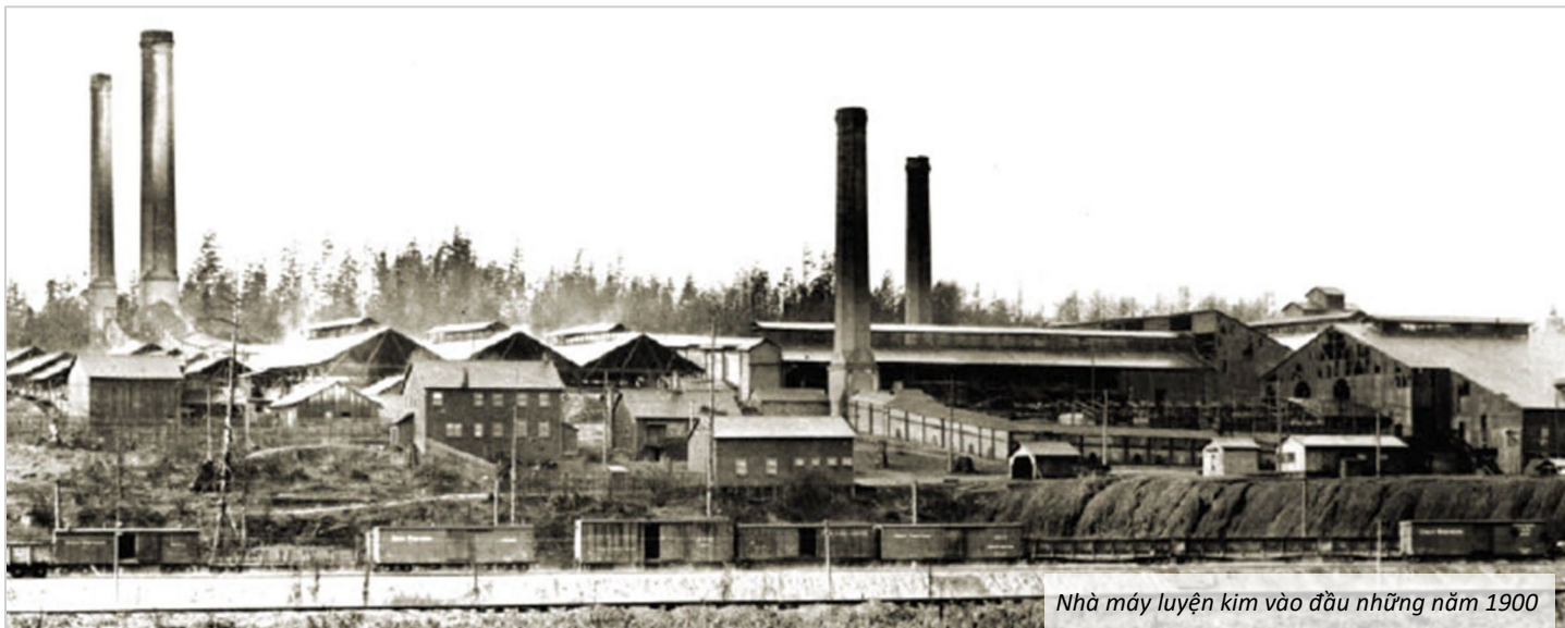
Nhà máy luyện kim vào đầu những năm 1900