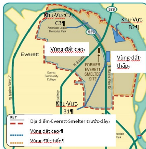
Bản đồ Dự Án Tẩy Nhiễm Everett Smelter. Lập kế hoạch tẩy nhiễm ở các Khu Vực B1, B2, C2 và C3 bắt đầu trong năm nay.