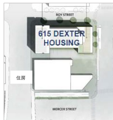
圖 2. 擬議重建的圖像。