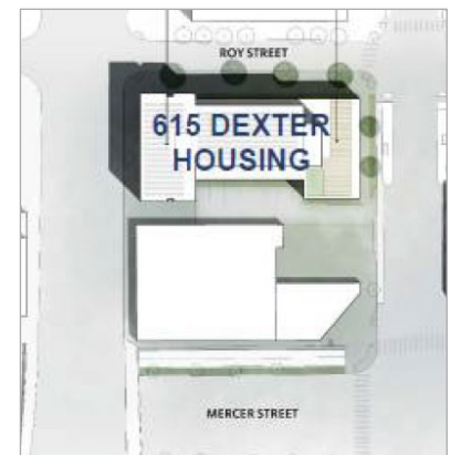
Figura 2. Imagen de la propuesta reurbanización.

Se planea reurbanizar la Propiedad con una torre de 18 pisos y estacionamiento soterrado el cual abarca toda la huella de la Propiedad. Se planean dos niveles de estacionamiento soterrado. El edificio será una torre de residencias multifamiliar que incluirá una mezcla de unidades a tasa de mercado y unidades de ingresos limitados variando de 60 a 85 por ciento del ingreso medio del área. Se espera que la reurbanización comience en el 2022 y se espera que esté completa para el 2024.