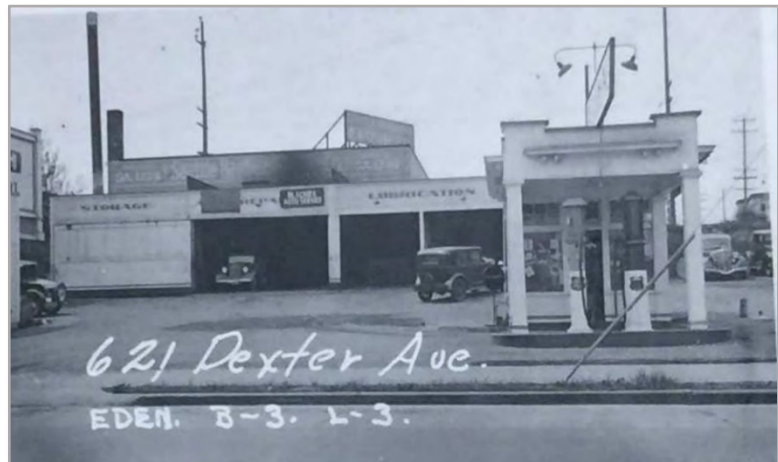
Figura 1. Estación de reparación de automóviles y dispensa de gasolina localizada en la porción noreste del sitio alrededor del 1930.

El Sitio de Seattle DOT Dexter Parcel está en general localizado en el 615 de Dexter Avenue North (Propiedad) en el vecindario de South Lake Union de Seattle. La Propiedad es de 0.56 acres y está limitada por el norte por Roy Street, al sur por un callejón, al este por Dexter Avenue N, y al oeste por Aurora Avenue N. Contaminación en el Sitio está presente en una porción de la Propiedad y se extiende hacia el callejón adyacente. Existían residencias privadas en la Propiedad hasta principios del siglo 20. En los 1920s, se construyó un edificio en la parte sur de la Propiedad, y fue luego expandido hacia el norte y el este en los 1940s. Ocuparon el edificio varios negocios comerciales y de industria ligera, incluyendo compañías de manufactura de papel de lijar, carpintería, y de pisos de madera; un manufacturero de plafones de pared cubiertos, una facilidad de mezcla y almacenamiento de plástico, y un restaurante. Más recientemente, ocupó el edificio un negocio de venta y servicio de fotocopiadoras. También operó una estación de dispensa de combustible durante los 1930s y los 1940s (vea la Figura 1).