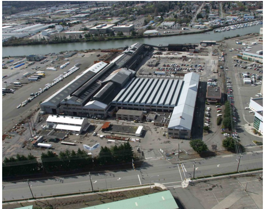
Vista aérea del sitio de Jorgensen Forge Corp (mirando hacia el oeste), en la actualidad.