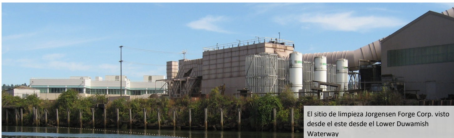
El sitio de limpieza Jorgensen Forge Corp. visto desde el este desde el Lower Duwamish Waterway