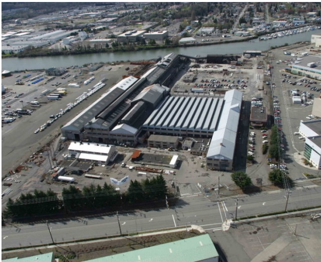
Vista del sitio de Jorgensen Forge Corp., mirando hacia el oeste