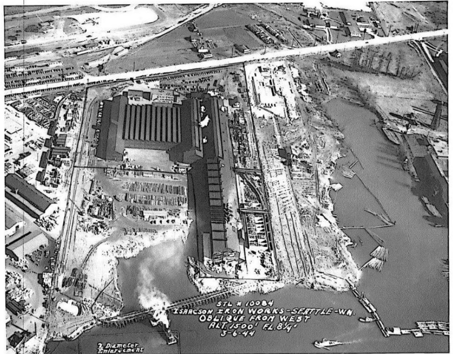
Vista aérea del Sitio de Jorgensen Forge Corp. (mirando hacia al este) durante el 1944.

Todos estos contaminantes se encontraron en niveles sobre los permitidos por la ley estatal de limpieza, la Ley Modelo para el Control de Sustancias Tóxicas ( MTCA 1 , por sus siglas en inglés ). MTCA exige la limpieza de estos contaminantes.