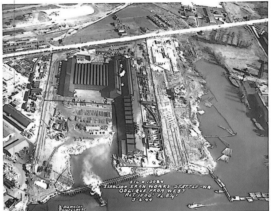
Địa điểm Jorgensen Forge Corp nhìn từ trên không (nhìn về phía đông) vào năm 1944.

Tất cả những chất gây ô nhiễm này đều được tìm thấy ở mức độ cao hơn luật tẩy nhiễm của tiểu bang, Mô Hình Kiểm Soát Chất Độc Hại ( MTCA 1 ). MTCA quy định các chất gây ô nhiễm này phải được tẩy nhiễm.