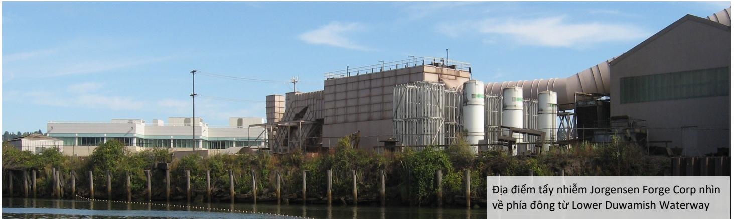
Địa điểm tẩy nhiễm Jorgensen Forge Corp nhìn về phía đông từ Lower Duwamish Waterway