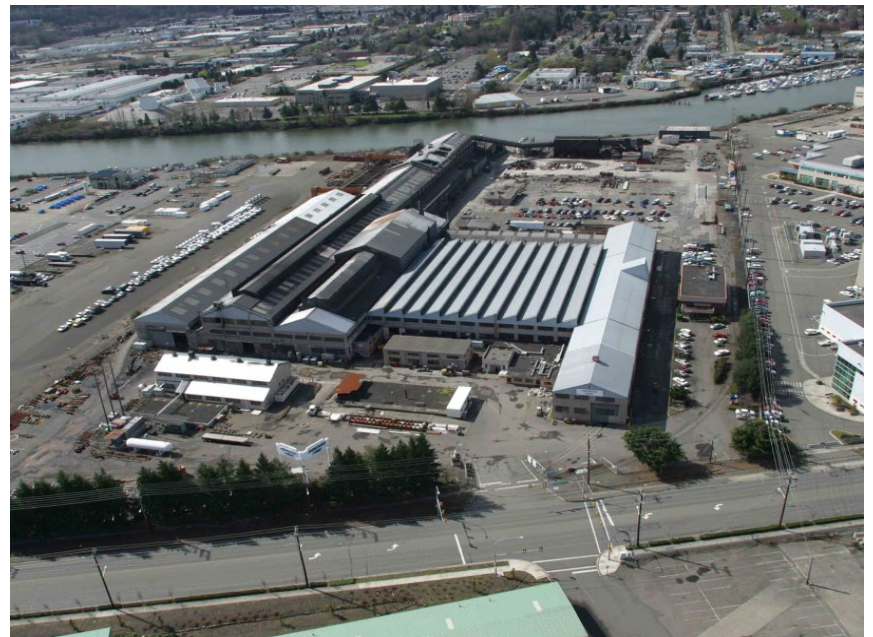
Địa điểm Jorgensen Forge Corp nhìn từ trên không hiện tại (nhìn về phía tây)