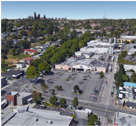
Rainier Mall 清理站點俯瞰圖