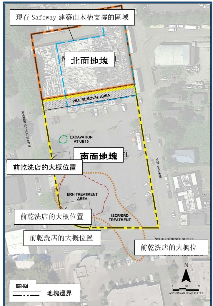
Rainier Mall 清理站點前乾洗經營、現存建築和污染區