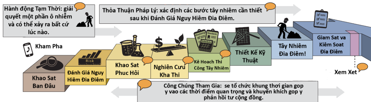
Hình 2: Đồ họa thông tin về quy trình tẩy nhiễm chính thức.

BSB hiện đang trong giai đoạn cuối của quá trình tẩy nhiễm, giám sát và kiểm soát việc sử dụng địa điểm. Chúng tôi quy định BSB giám sát nước ngầm để đảm bảo rằng phương pháp tẩy nhiễm hiện tại được hiệu quả.