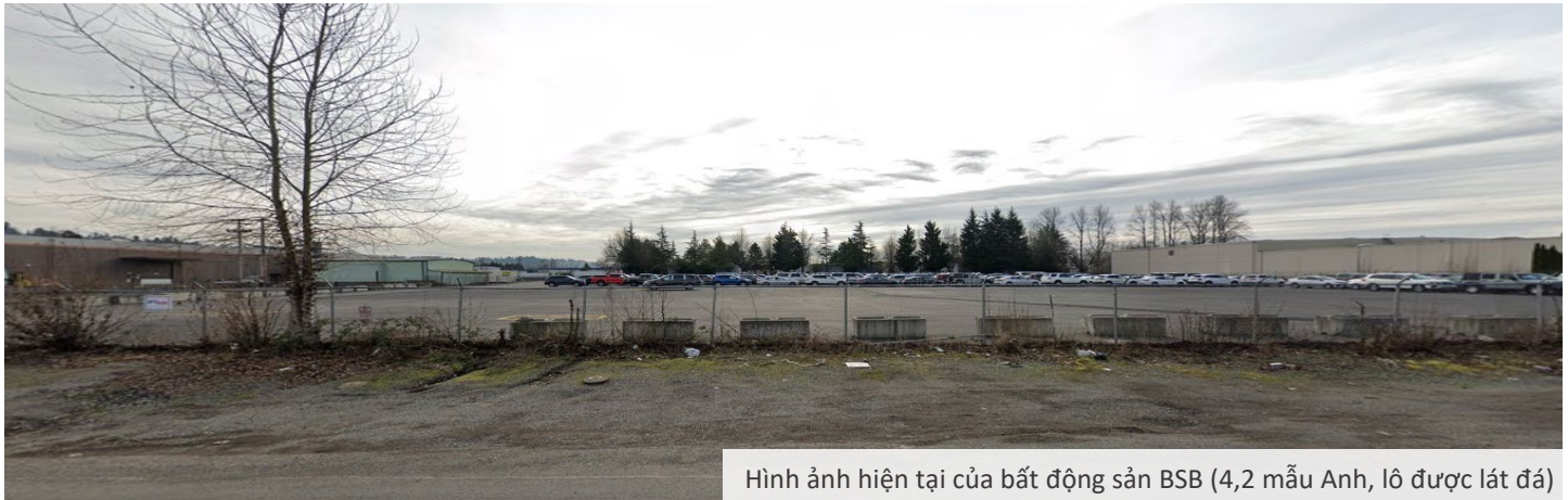
Hình ảnh hiện tại của bất động sản BSB (4,2 mẫu Anh, lô được lát đá)