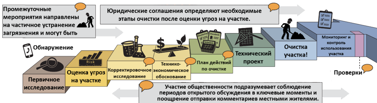
Рисунок 2: официальная инфографика процесса очистки.

В настоящее время компания BSB находится на последнем этапе процесса очистки - контроль и управление использованием данного участка. Мы требуем, чтобы BSB следила за подпочвенными водами и за тем, чтобы текущий метод очистки был эффективным.