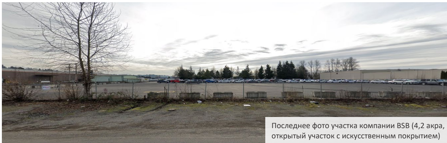
Последнее фото участка компании BSB (4,2 акра, открытый участок с искусственным покрытием)

Принимаются комментарии 9 мая - 24 июня 2022 года