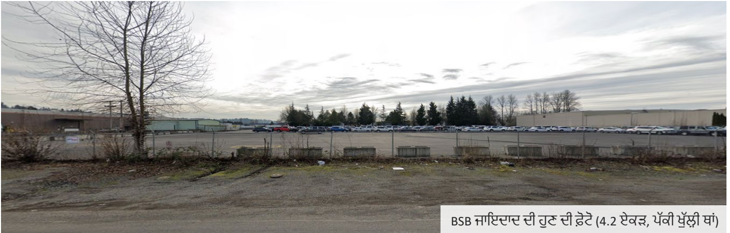
BSB ਜਾਇਦਾਦ ਦੀ ਹੁਣ ਦੀ ਫੋਟੋ (4.2 ਏਕੜ, ਪੱਕੀ ਖੁੱਲ੍ਹੀ ਥਾਂ)