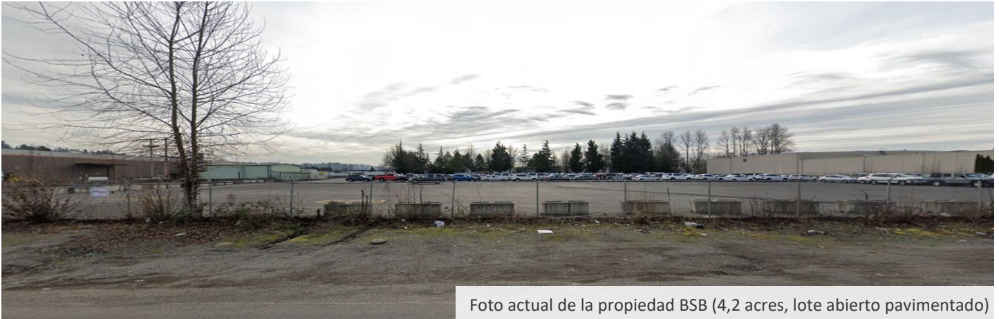
Foto actual de la propiedad BSB (4,2 acres, lote abierto pavimentado)