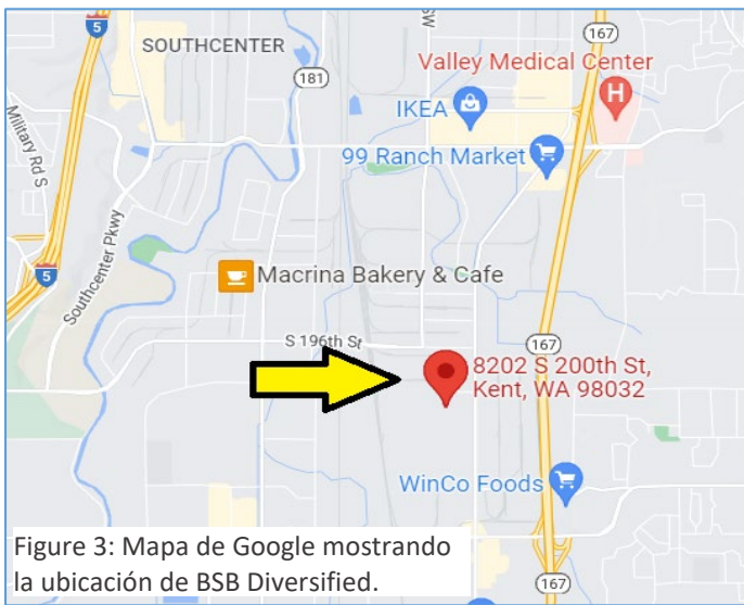
Figure 3: Mapa de Google mostrando la ubicación de BSB Diversified.