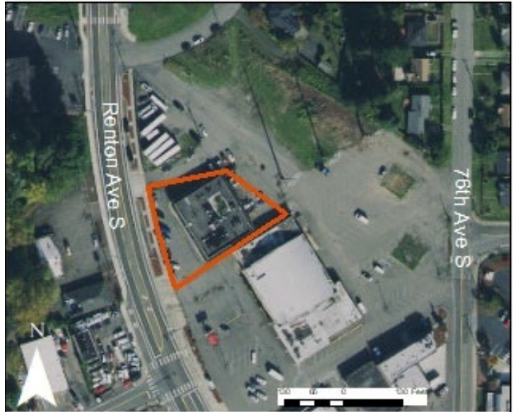
Tanawin mula sa himpapawid ng site, sa kasalukuyan.

Natuklasan ang lahat ng contaminant na ito na lampas sa mga antas na itinakda sa batas ng estado sa paglilinis, ang Batas ukol sa Huwaran ng Pagkontrol sa Lason ( Model Toxics Control Act, MTCA 1 ). Iniaatas ng MTCA na linisin ang mga contaminant na ito.