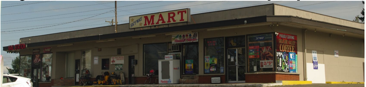
Paglilinis sa Boathouse Inc Renton Skyway Site