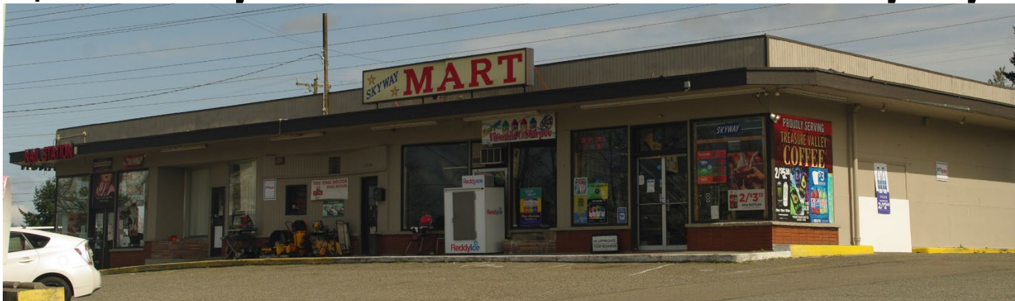
Địa Điểm Tẩy Nhiễm Boathouse Inc Renton Skyway