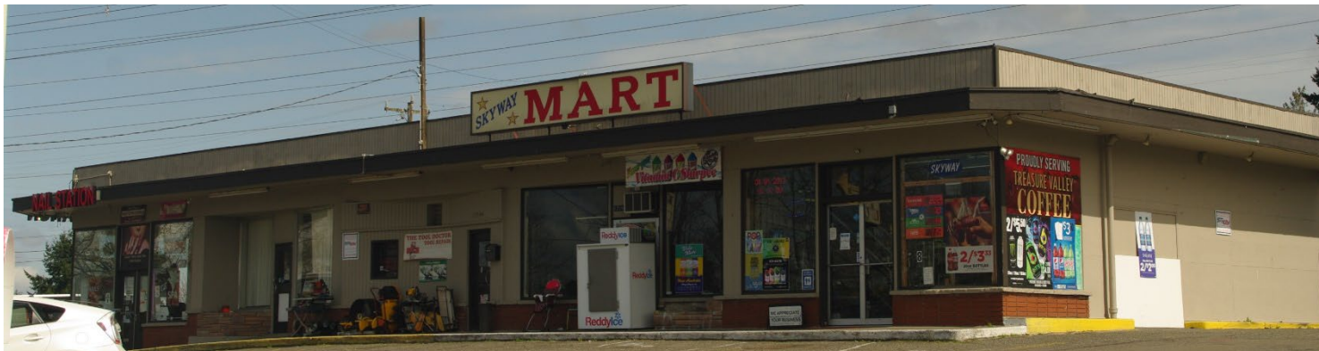
Boathouse Inc Renton Skyway 清理站