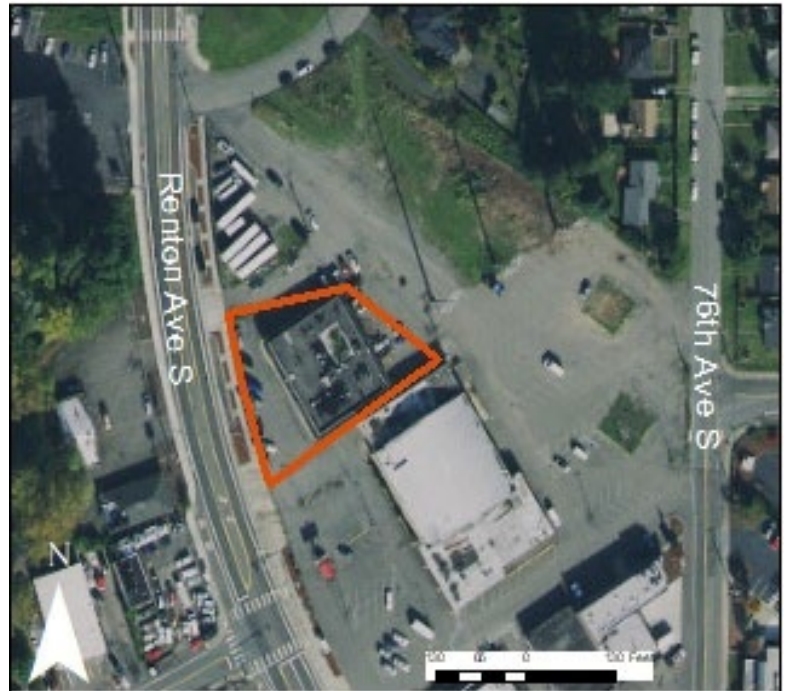
Boathouse Inc Renton Skyway 清理站點鳥瞰圖

使用社區意見和本土藝術家的作品為場地選出設計元素。如果您對該物業的重建項目有任何疑問或意見，請在此處發表評論。 https://bit.ly/SkywayTowncenter