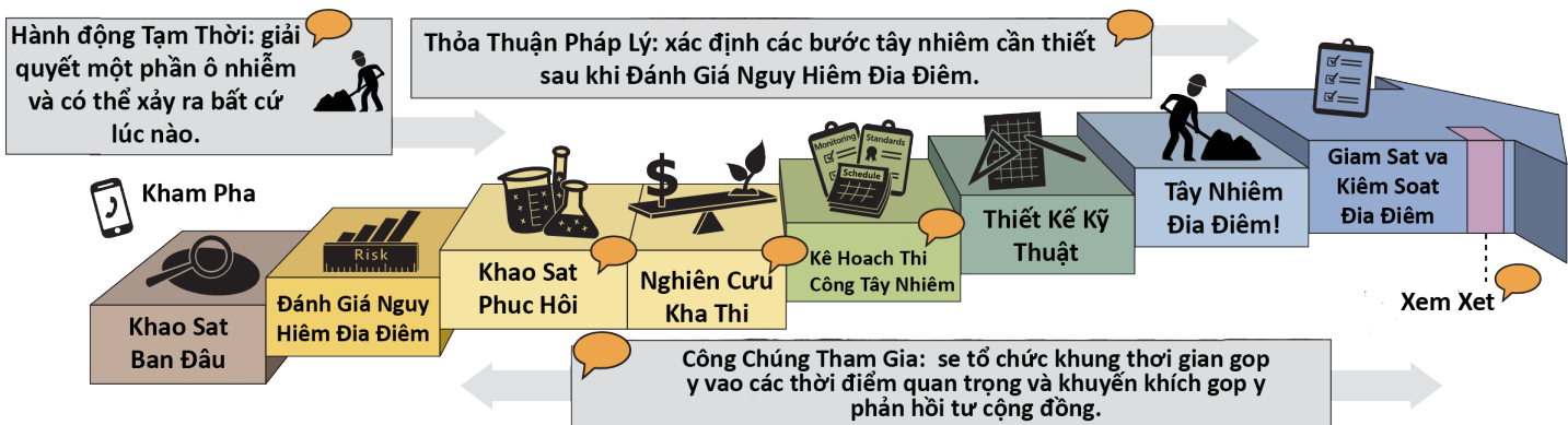
Quy trình tẩy nhiễm chính thức của bang Washington ( tải xuống văn bản giải thích )

Đạo luật Mô Hình Kiểm Soát Chất Độc là luật làm sạch môi trường của bang Washington. Các luật này cung cấp các quy định về tẩy nhiễm địa điểm bị ô nhiễm và đặt ra các tiêu chuẩn bảo vệ sức khỏe con người và môi trường. Ecology thực hiện quy trình tẩy nhiễm MTCA cleanup process 3 và giám sát việc tẩy nhiễm.