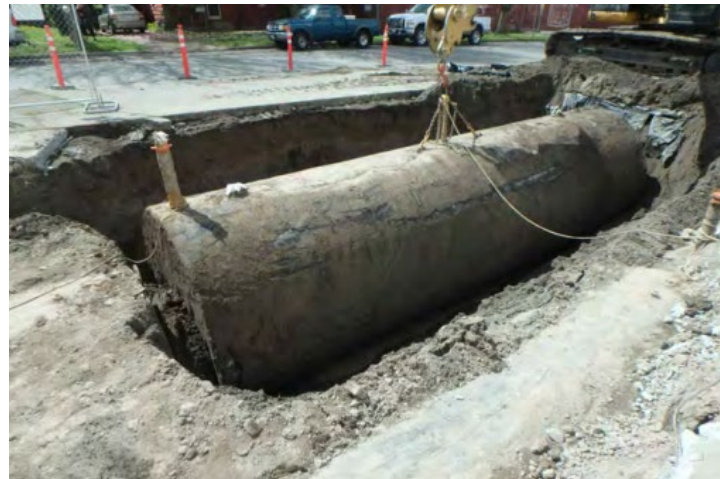
Các bể chứa ngầm được di chuyển khỏi địa điểm