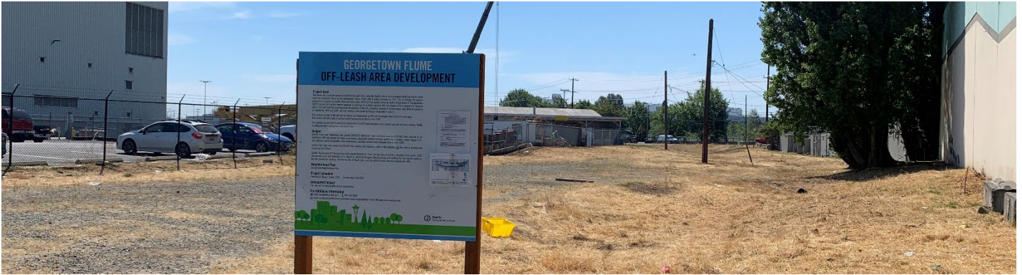
North Boeing Field Georgetown 蒸汽廠清理工作站點