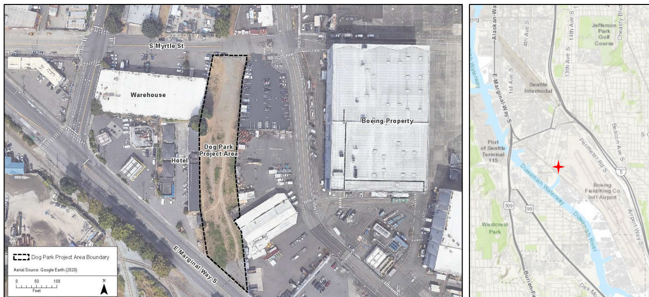
North Boeing Field-Georgetown 蒸汽廠現場和狗公園項目區的鳥瞰圖和地圖視圖。

狗公園項目區是 Georgetown 蒸汽廠水槽南端的位置。水槽是一個管道和溝渠系統，將水從歷史悠久的蒸汽廠排放到下 Duwamish 水道 (LDW) 的 Slip 4，直到 1960 年代。Dog Park 項目區還包含前 Ellis Ave.，變電站，該變電站連同水槽的殘餘物於 2009 年被拆除。目前 Dog Park 項目區是一片未開發的地塊，覆蓋著植被、裸露的泥土和礫石。這項臨時清理工作行動將允許公眾有益地使用 Dog Park，在全場範圍內清理工作行調查和可行性研究完成之前。