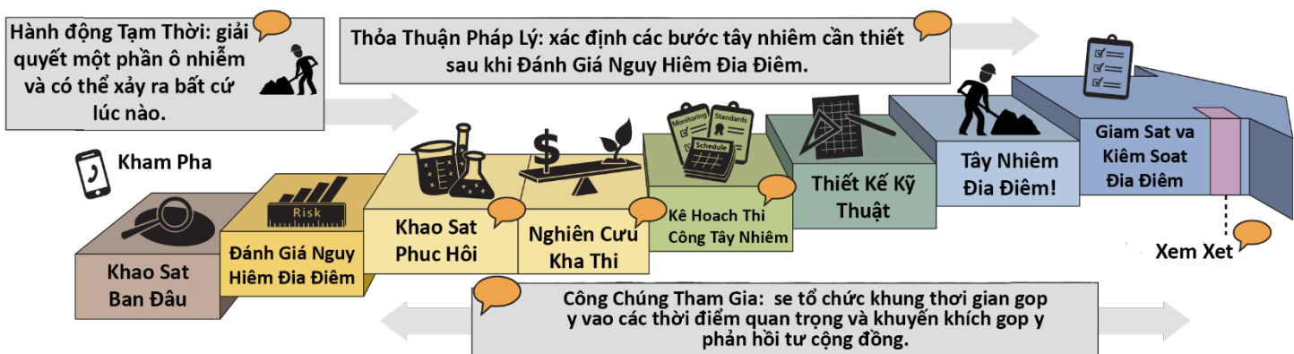
Quy trình tẩy nhiễm chính thức của bang Washington ( Tải xuống văn bản giải thích 3 )

Đạo Luật Mô Hình Kiểm Soát Chất Độc là luật làm sạch môi trường của bang Washington. Nó cung cấp các quy định về tẩy nhiễm địa điểm bị ô nhiễm và đặt ra các tiêu chuẩn bảo vệ sức khỏe con người và môi trường. Ecology thực hiện quy trình tẩy nhiễm MTCA 2 và giám sát việc tẩy nhiễm.