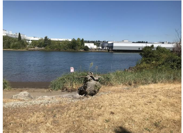
ከ Duwamish Waterway Park የታችኛው የ Duwamish የውሃ ተፋሰስ እይታ፣ ኦገስት 2022

የ Duwamish Waterway Park ጣቢያው ከታችኛው Duwamish የውሃ ተፋሰስ 4 ስፕሪንግ ጣቢያ አጠገብ ነው። ይህም የ Duwamish ወንዝ 5 ማይልን ያካትታል። የ U.S. የአካባቢ ጥበቃ ኤጀንሲ (Environmental Protection Agency, EPA) በ 2001 የ LDW Superfund Site 5 ን ወደ Superfund ብሄራዊ ቅድሚያ የሚሰጣቸው ነገሮች ዝርዝር ውስጥ አካል ነው። ኢኮሎጂ የብክለት ምንጮች ወደ LDW Superfund Site እንዳይገቡ ለማቆም ወይም ለመቀነስ እየሰራ ነው። ይህም ጥረት “ ምንጭ ቁጥጥር 6 ” በመባል ይታወቃል። ይህም EPA የወንዙን ደለል በማጽዳት እንዲቀጥል ነው።