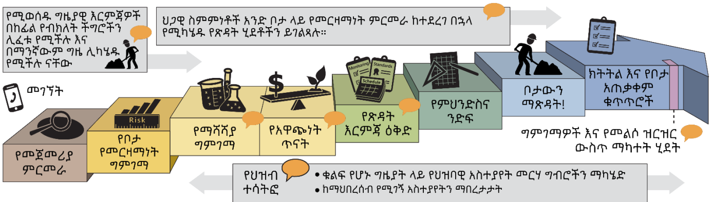
የ Washington መደበኛ የማጽዳት ሂደት ( የጽሑፍ ማብራሪያ ያውርዱ ) 10

የሞዴል መርዛማ ቁጥጥር ህግ ( MTCA ) 7 የ Washington የአካባቢ ጽዳት ህግ ነው። የተበከለ ቦታን ለማጽዳት መስፈርቶችን ያቀርባል እናም የሰውን ጤና እና አካባቢን የሚጠብቁ ደረጃዎችን ያዘጋጃል። ኢኮሎጂ የ MTCA ጽዳት ሂደት 8 ተግባራዊ ያደርጋል እናም ጽዳቶችን ይቆጣጠራል።