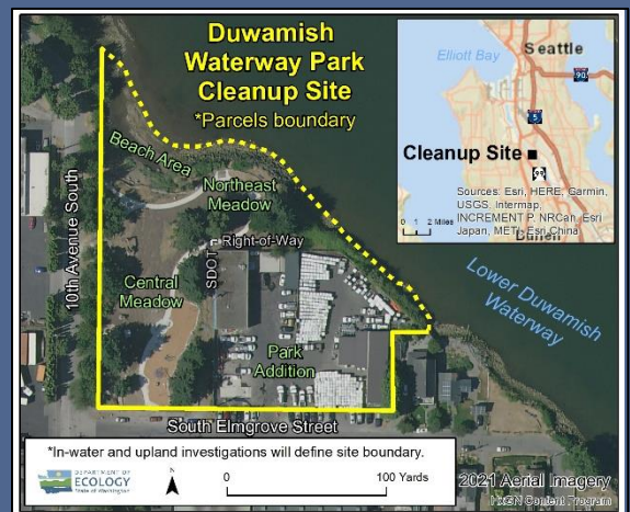
የ Duwamish Waterway Park ማጽጃ ጣቢያ የአየር ላይ ካርታ፣ 2021

የ ADA አቀባበልን ለመጠየቅ፣ ኢኮሎጂን በስልክ በ 425-324-5901 ላይ ያነጋግሩ ወይም LDW@ecy.wa.gov ላይ ኢሜይል ያድርጉ ወይም ecology.wa.gov/Accessibility ን ይጎብኙ። ለሪሌይ የስልክ አገልግሎት ወይም TTY በ 711 ወይም 877-833-6341 ላይ ይደውሉ።