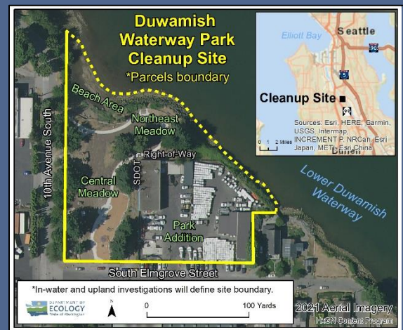
ទិដ្ឋភាពពីលើអាកាសនៃទីតាំងសម្អាតឧស្ម័នផ្លូវទឹកយ៉ាមីស (Duwamish Waterway Park) ឆ្នាំ 2021

សម្រាប់សេវាបញ្ជូនបន្ត ឬ TTY សូមហៅទូរស័ព្ទលេខ 711 ឬ 877-833-6341.