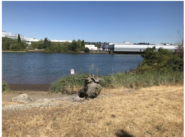
ទិដ្ឋភាពផ្លូវទឹកឌុយវ៉ាមីសផ្នែកខាងក្រោម ( Lower Duwamish Waterway ) ពីឧទ្យានផ្លូវទឹកឌុយវ៉ាមីស ( Duwamish Waterway ) នៅខែសីហា ឆ្នាំ 2022

ទីតាំងឧទ្យានផ្លូវទឹកឌុយវ៉ាមីស ( Duwamish Waterway Park ) ស្ថិតនៅជាប់នឹងទីតាំងមានសារធាតុបំពុលដែលទាមទារសម្អាតនៅផ្នែកខាងក្រោម ( Lower Duwamish Waterway 4 Superfund Site ) ដែលមានកំណត់ផ្លូវទឹកឌុយវ៉ាមីស ( Duwamish River ) ប្រវែង 5 ម៉ាយ។ ទីភ្នាក់ងារ ការពារបរិស្ថានសហរដ្ឋអាមេរិក ( the U.S. Environmental Protection Agency ( EPA ) ) បានបន្ថែម ទីតាំងមានសារធាតុបំពុលដែលទាមទារសម្អាតនៅទីតាំងមានសារធាតុបំពុលដែលទាមទារសម្អាតនៅផ្នែកខាងក្រោម ( LDW Superfund Site ) 5 ទៅក្នុងបញ្ជីអាទិភាពថ្នាក់ជាតិសារធាតុបំពុលដែលទាមទារសម្អាត ( Superfund National Priorities List ) នៅឆ្នាំ 2001 ។ ក្រសួងបរិស្ថានវិទ្យា ( Ecology ) កំពុងធ្វើការដើម្បីបញ្ឈប់ ឬកាត់បន្ថយប្រភពនៃការចម្លងធាតុបំពុល ទីតាំងមានសារធាតុបំពុលដែលទាមទារសម្អាតនៅផ្នែកខាងក្រោម ( LDW Superfund Site ) ដែលជាភូមិភាគខ្សែបង្រួមដែលគណៈកម្មាធិការ “ ការគ្រប់គ្រងប្រភព ” 6 ដូច្នេះទីភ្នាក់ងារ EPA អាចបន្តដំណើរការសម្អាតកាកសំណល់នៅទីនោះ។