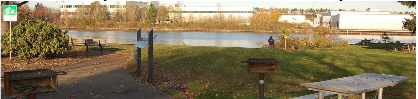
Bờ sông tại Duwamish Waterway Park