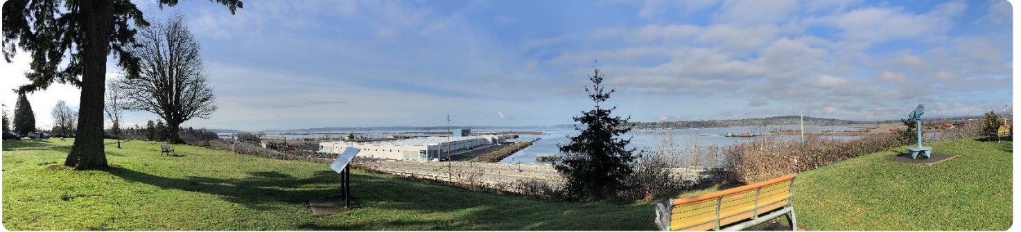
Bancos en el Hibulb Lookout.