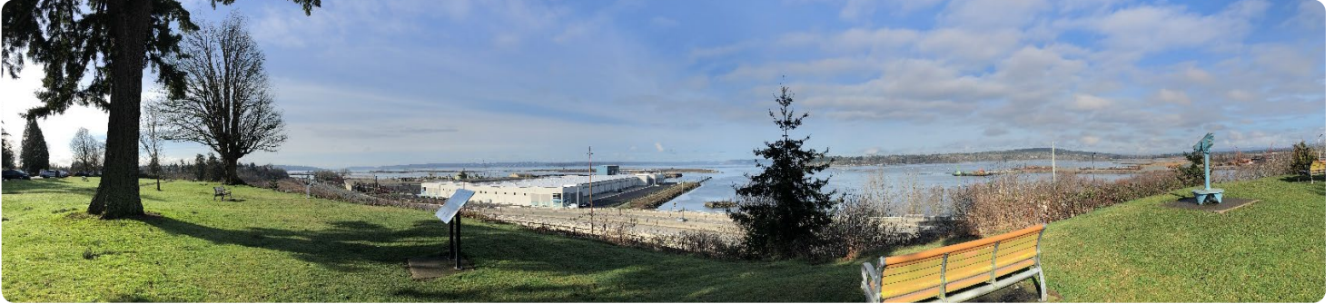
Ghế dài tại Đài quan sát Hibulb nhìn ra nơi Sông Snohomish kết nối với Puget Sound.