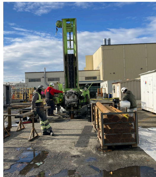
Бурение грунта и обустройство колодца, здание С-29, ноябрь 2022 г.

Процедура очистки участков в рамках МТСА 3 выполняется поэтапно (см. график ниже) в соответствии с определяемым с учетом обстоятельств расписанием.