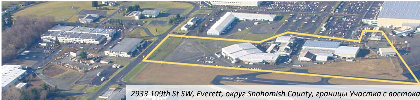
2933 109th St SW, Everett, округ Snohomish County, границы Участка с востока