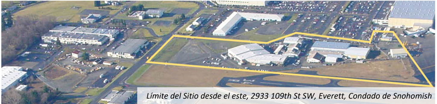
Límite del Sitio desde el este, 2933 109th St SW, Everett, Condado de Snohomish