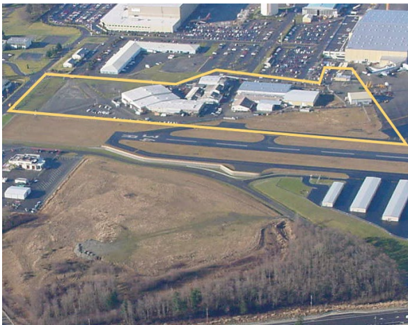
Límite de Sitio desde el este