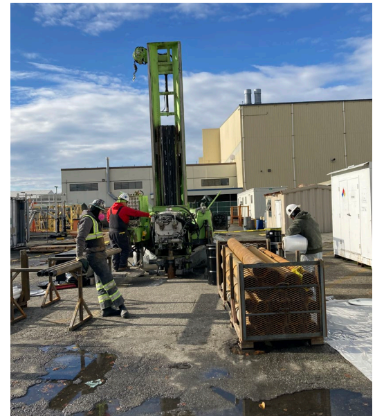
Barrenos de suelo e instalación de pozos, Edificio C-29, noviembre del 2022

El proceso de limpieza de MTCA 3 se completa en pasos (ver la gráfica abajo) a lo largo de un tiempo variado.