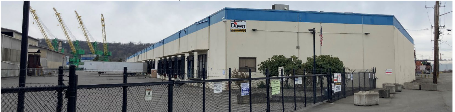
អគារផលិតផលអាហារ Dawn