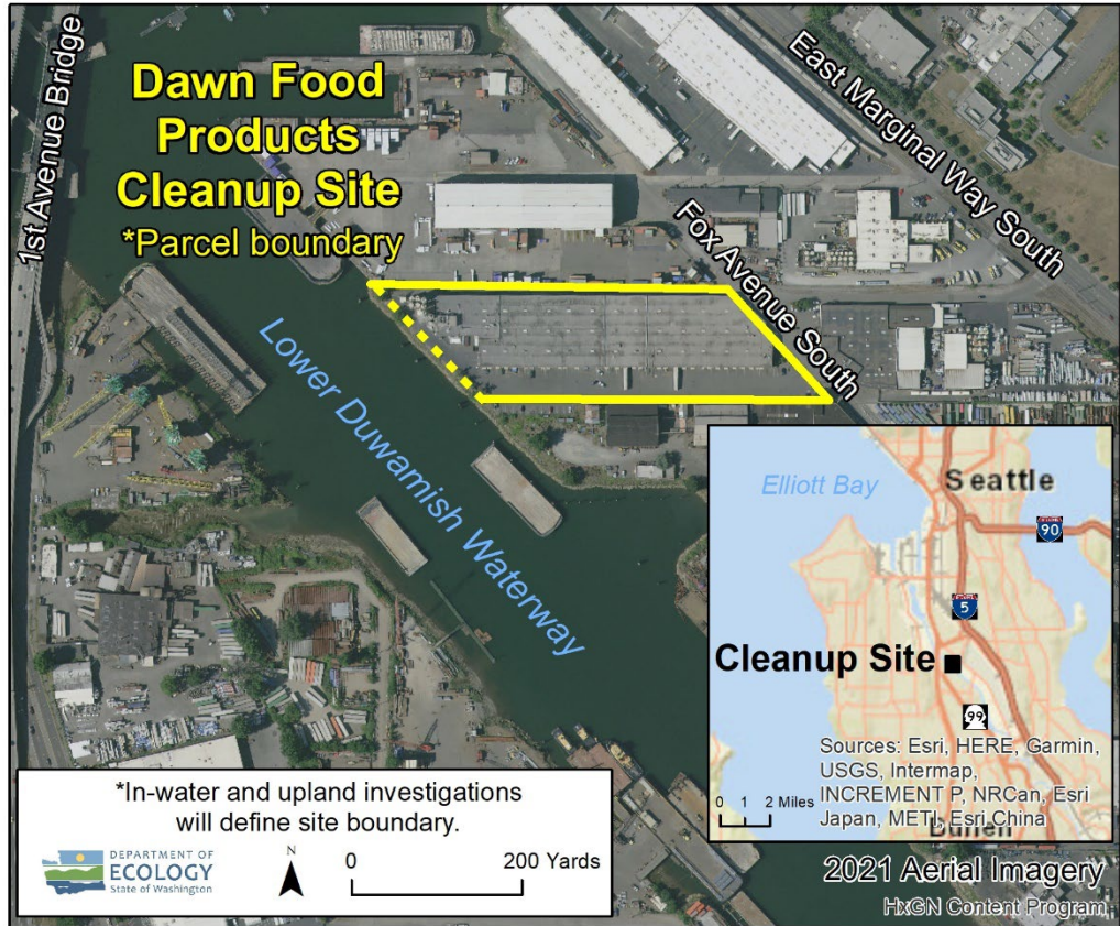
ទិដ្ឋភាពពីលើអាកាសនៃកំប៉ាល់ផលិតផលអាហារដោន (Dawn Food Products Parcel)

ភ័ស្តុតាងបញ្ជាក់ប្រវត្តិសាស្ត្របង្ហាញថាបរិវេណនេះត្រូវបានគេប្រើប្រាស់ចាប់តាំងពីឆ្នាំ 1917 យ៉ាងតិចសម្រាប់ការប្រើប្រាស់ខាងពាណិជ្ជកម្ម និងឧស្សាហកម្មផ្សេងៗ រួមទាំងការសាងសង់កំប៉ាល់ ការផលិតដែកស ឆ្លឹក និងការផលិតម៉ាស៊ីន ភ្លើង ការផលិតរាវស្រោចដី ឡូត៍ត្រូនិច ការបាញ់ថ្នាំ ការផ្គុំទូទៅ និងការិយាល័យ។ ប្រតិបត្តិការសាងសង់កំប៉ាល់បានកើតឡើងជាចម្បងនៅ ភាគនិរតីនៃបរិវេណនេះ។ រចនាសម្ព័ន្ធប្រហែលប្រាំពីរបានដកចេញ និងជំនួសដោយឃ្នាំងដែលមានស្រាប់នៅ 1977។ រចនាសម្ព័ន្ធដែលមានស្រាប់មានទំហំប្រហែល 128,800 ហ្វីតការ៉េ (2.96 អាវ) ដែលក្នុងនោះបច្ចុប្បន្នមានអាហារស្លក់និង ប្រេងឆាត្រូវបានរក្សាទុក។ ឃ្នាំងនេះត្រូវបានប្រើប្រាស់ដោយក្រុមហ៊ុនម្តងម្កាលអាហារជាច្រើនអស់រយៈពេលជាច្រើន ទសវត្សរ៍មកហើយ។