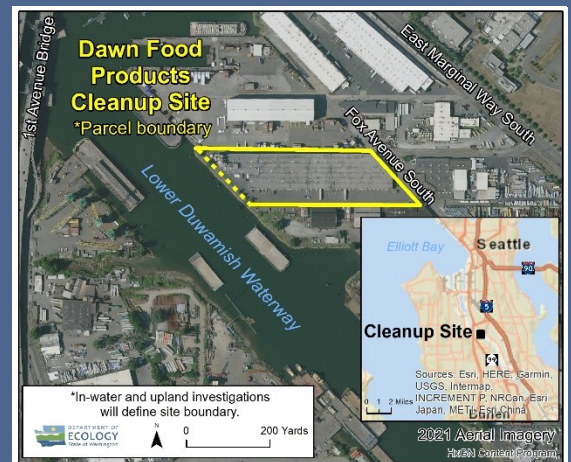
Mapa aéreo de Dawn Food Products sitio de la limpieza

Para solicitar una adaptación conforme a la Ley para Estadounidenses con Discapacidades, llame a Ecology al 425-533-5537, envíe un correo electrónico a LDW@ecy.wa.gov , o visite la página web ecology.wa.gov/Accessibility . Para el servicio de relevo o por TTY (teléfono de texto) llame al 711 o al 877-833-6341.