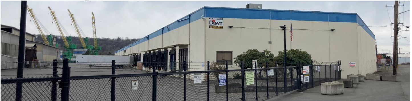
Edificio principal de Dawn Food Products