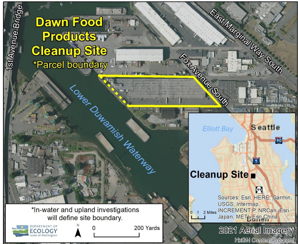
Vista aérea de la parcela de Dawn Food Products