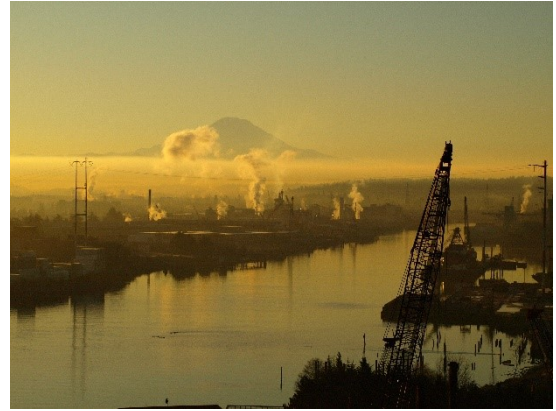
Vista del canal inferior del río Duwamish

El sitio de Dawn Food Products se encuentra junto al sitio del Superfondo del canal inferior del río Duwamish 1 , que incluye un tramo de 5 millas del río Duwamish. En 2001, la Agencia de Protección Ambiental (Environmental Protection Agency, EPA) de Estados Unidos agregó el sitio del Superfondo del LDW 2 a la lista de prioridades nacionales del Superfondo. Ecology está trabajando para detener o reducir las fuentes de contaminación en el sitio del Superfondo del LDW, un esfuerzo conocido como “ control del foco de origen ” 3 , para que la EPA pueda proceder con la limpieza de los sedimentos del río.