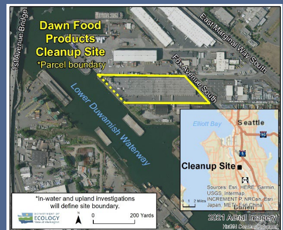
Bản đồ hiện trường dọn sạch Dawn Food Products nhìn từ trên không

Để yêu cầu điều chỉnh hợp lý theo Đạo Luật Người Khuyết Tật Hoa Kỳ (Americans with Disabilities Act, ADA), xin liên lạc với Ecology qua điện thoại theo số 425-533-5537 hoặc gửi email về LDW@ecy.wa.gov , hoặc truy cập trang ecology.wa.gov/Accessibility . Để sử dụng Dịch Vụ Tiếp Âm hay TTY, xin gọi số 711 hoặc 877-833-6341.