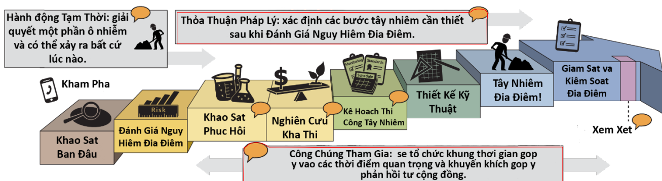
Quy trình dọn sạch chính thức của Washington ( tải văn bản giải thích 6 )

Đạo Luật Kiểm Soát Chất Độc Theo Mô Hình (Model Toxics Control Act, MTCA 4 ) là điều luật vệ sinh môi trường của Washington. Luật này đặt ra các yêu cầu đối với việc dọn sạch hiện trường ô nhiễm cũng như đặt ra những tiêu chuẩn bảo vệ sức khỏe con người và môi trường. Ecology triển khai quy trình dọn sạch theo MTCA 5 và giám sát các hoạt động dọn sạch.