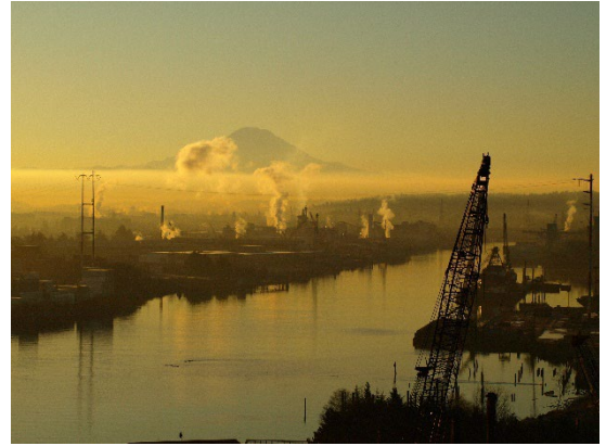
Lower Duwamish Waterway 景色

Dawn Food Products 场地与 Lower Duwamish Waterway 1 Superfund Site 相邻，该地块包含了一段 Duwamish River，长度 5 英里。美国国家环境保护局 (U.S. Environmental Protection Agency, EPA) 于 2001 年将 LDW Superfund Site 2 列入 Superfund 国家优先事项清单。生态部正在努力消除或减少 LDW Superfund Site 的污染源，这项工作被称为“ 源头控制 3 ”，这样 EPA 可以开始着手清理河流沉积物。