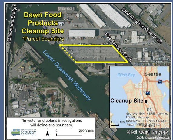
Dawn Food Products 鸟瞰图 清理点

ecology.wa.gov/Accessibility , 与生态部联系。如需中继服务或 TTY, 请拨打 711 或 877-833-6341。