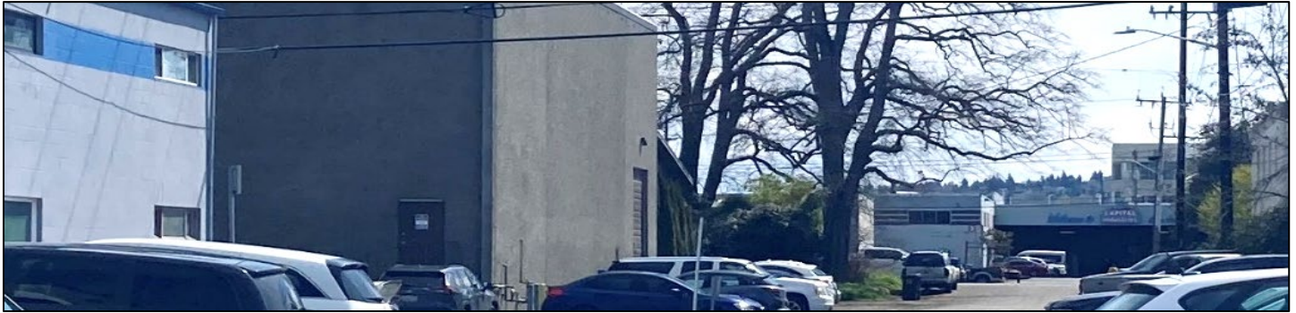
Hình 1: Quang cảnh các cơ sở Art Brass Plating, Blaser Die Casting, and Capitol Industries ở Địa điểm West of 4th tại Georgetown.