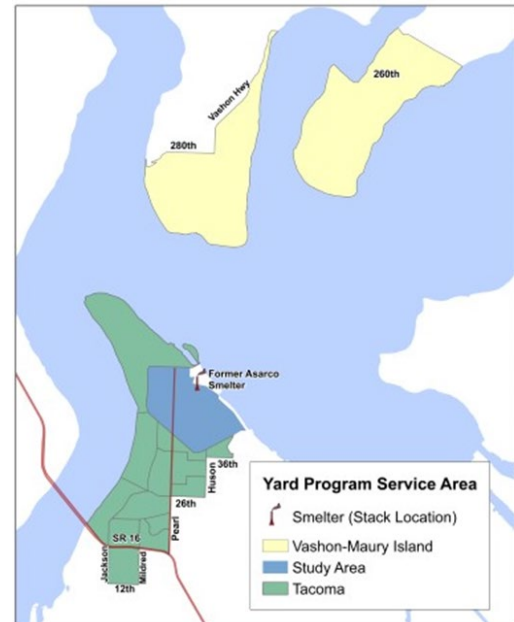
Figura 1. La secuencia de reemplazo del suelo del Programa Jardín guía el trabajo de limpieza en el área de servicio. El área de servicio del programa en Tacoma se muestra en verde, fuera del límite del área de estudio de EPA. Las áreas de la Isla Vashon-Maury (se muestran en amarillo) son parte del área de servicio del Programa Jardín, pero no están incluidas en esta actualización de la secuencia de limpieza. La chimenea del horno muestra donde estuvo una vez ubicado el horno de fundición de cobre de Asarco en la parte norte de Tacoma.

La fundición cerró en 1986, sin embargo, arsénico, plomo y otros metales pesados permanecen en el suelo. Las áreas con los niveles más altos de arsénico y plomo en el suelo están en el norte de Tacoma y en el extremo sur de la Isla Vashon-Maury. Estas comunidades son el foco del área de servicio del Programa Jardín.