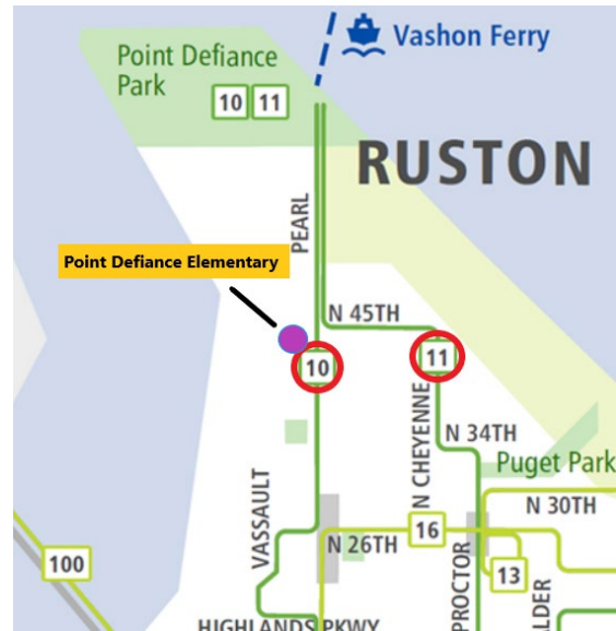
Figura 4. Rutas sugeridas de buses de Pierce Transit para rutas de buses cerca de Point Defiance Elementary. Se puede encontrar más información en su sitio web en https://bit.ly/3LcM829

El Programa de Jardines Residenciales del Penacho de la Fundación Tacoma del Departamento de Ecología del Estado de Washington está actualizando el plan de secuencia para el reemplazo del suelo en el área de servicio en la parte norte de Tacoma. Hay dos opciones para asistir a una presentación sobre esta actualización: