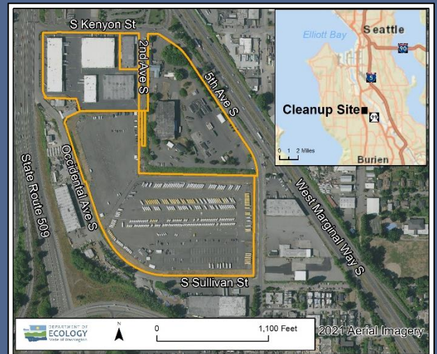
Bản đồ trên không của cơ sở làm sạch South Park Landfill, 2021

Để yêu cầu phương pháp hỗ trợ của Đạo Luật Người Khuyết Tật Hoa Kỳ (Americans with Disabilities Act, ADA), hãy liên hệ với Department of Ecology qua số điện thoại 425-229-3683 hoặc gửi email đến địa chỉ LDW@ecy.wa.gov hoặc truy cập ecology.wa.gov/Accessibility . Đối với Dịch Vụ Chuyển Tiếp hoặc TTY, hãy gọi 711 hoặc 877-833-6341.