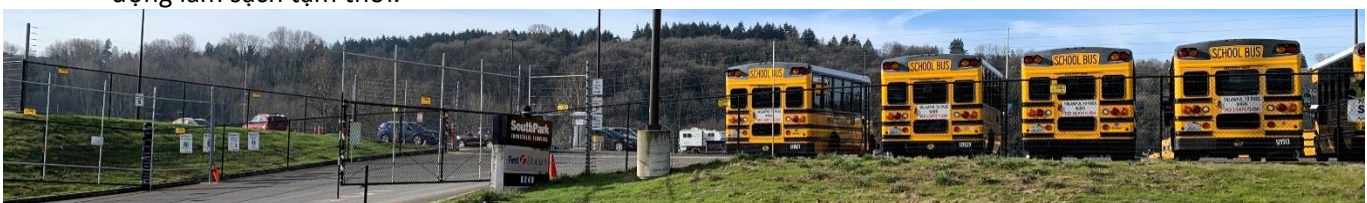
South Park Property Development (SPPD) từ 5th Avenue S.