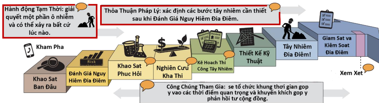
Quy trình làm sạch chính thức của Washington ( tải xuống phần giải thích bằng văn bản )

Mọi tài liệu xem xét của cơ sở này đều được tô viền đỏ như bên dưới.