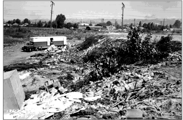
Việc sử dụng South Park Landfill trong quá khứ, khoảng những năm 1950