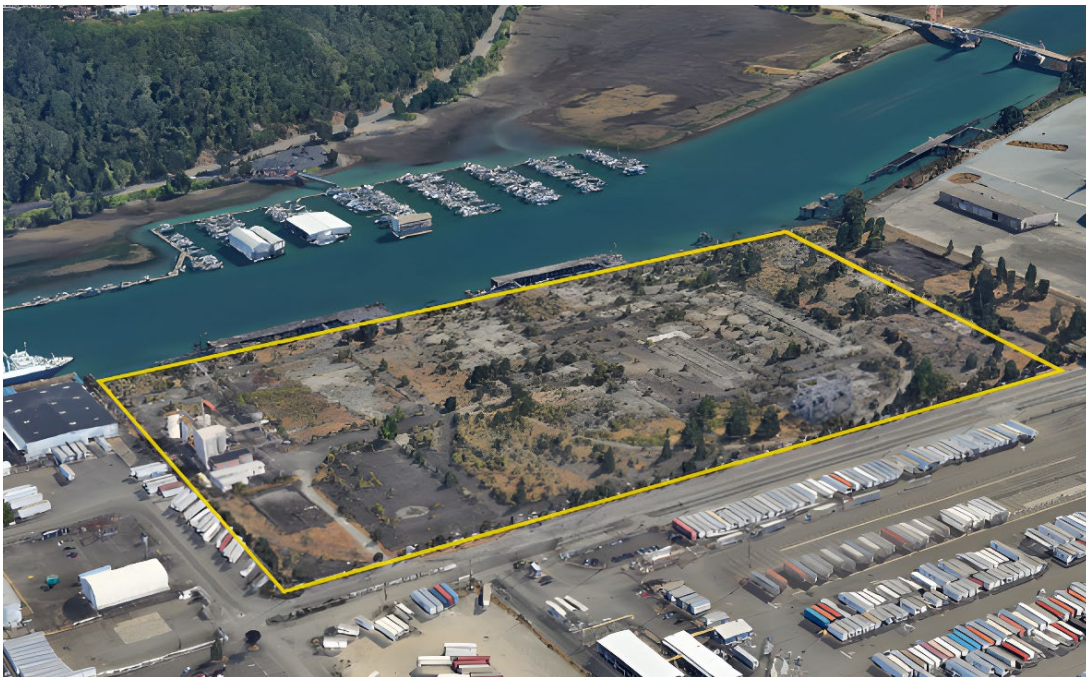
그림 3. 옥시덴탈 부지와 인근의 Hylebos Waterway.