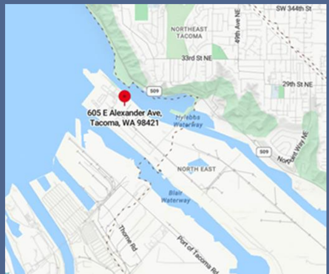
ទីតាំងនៃការដ្ឋានរបស់ក្រុមហ៊ុន Occidental Chemical ក្នុងទីក្រុង Tacoma ។

លទ្ធភាពចូលប្រើ៖ ដើម្បីស្នើសុំការសម្របសម្រួលពី ADA ចូលមើលគេហទំព័រ ecology.wa.gov/accessibility .