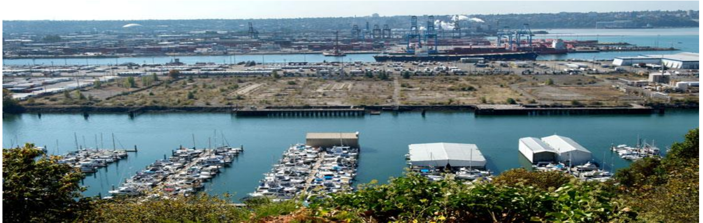
រូបភាព 1៖ ការដ្ឋានសម្ភាររបស់ក្រុមហ៊ុន Occidental ក្នុងទីក្រុង Tacoma រដ្ឋ Washington ។