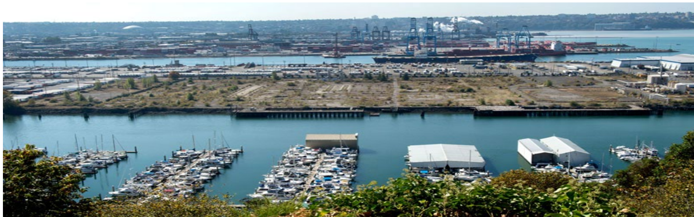
图 1: 位于华盛顿州 Tacoma 市的 Occidental 清理站点。