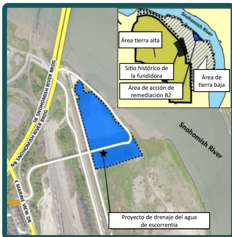
El área de trabajo de aguas pluviales (área B2) se encuentra a lo largo del río Snohomish, justo al este del puente del río Snohomish.

Para proteger al río Snohomish y las comunidades que dependen de él, en el 2023, Ecología y la Ciudad instalaron la primera fase de revestimientos dentro de las tuberías agrietadas para prevenir que el agua subterránea penetre el sistema. La segunda (y final) fase de revestimientos se instalará a fines del otoño del 2023.