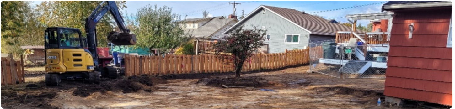
Construcción del Grupo de Limpieza del 2019