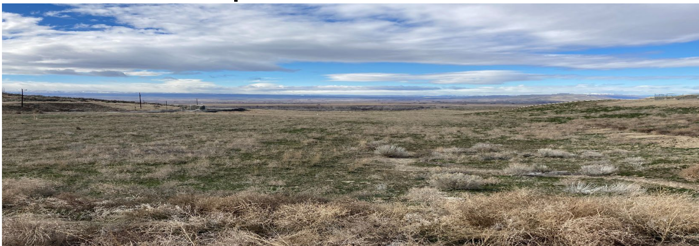
Snipes Mountain Landfill