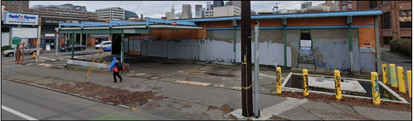
Spic N Span Cleaners 站点位置