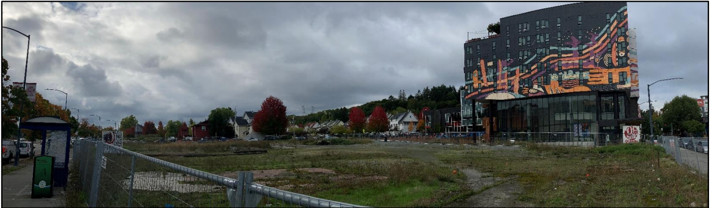
Sitio de limpieza de Holly Park