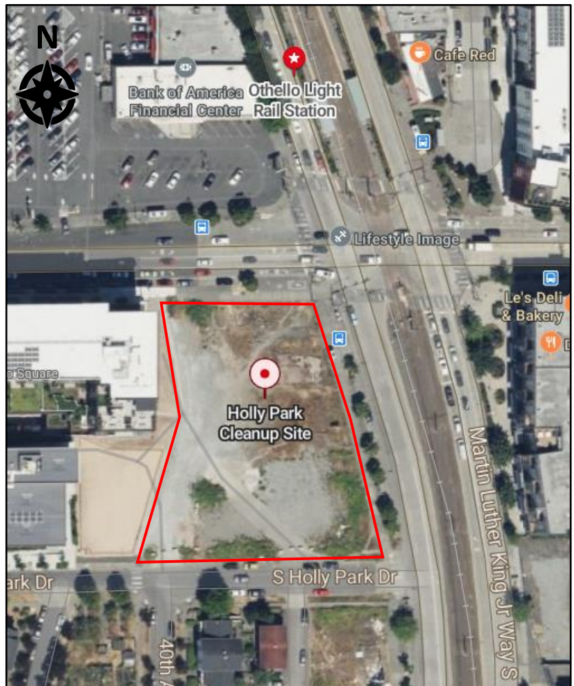
Hitsura ng lugar na makikita sa itaas

Ang pangangailangan para sa isang PPCD sa lugar na ito ay nagmumula sa makasaysayang paggamit ng ari-arian. Isa itong istasyon ng serbisyo sa retail mula noong 1940s hanggang 1979, gatungan at pasilidad sa pag-iinit ng langis mula 1960s hanggang 1994, at mayroon ding iba pang komersyal na gamit (tingi, restawran, at grocery). Ang demolisyon ng mga gusali ay naganap sa pagitan noong 2002-2005, at ang ari-arian ay bakante simula noon. Ang mga naunang operasyon na ito sa lugar ay nagresulta sa mga lugar ng kontaminasyon ng petrolyo sa lupa at tubig-bukal, ang lawak nito ay matutukoy sa panahon ng remedial investigation.