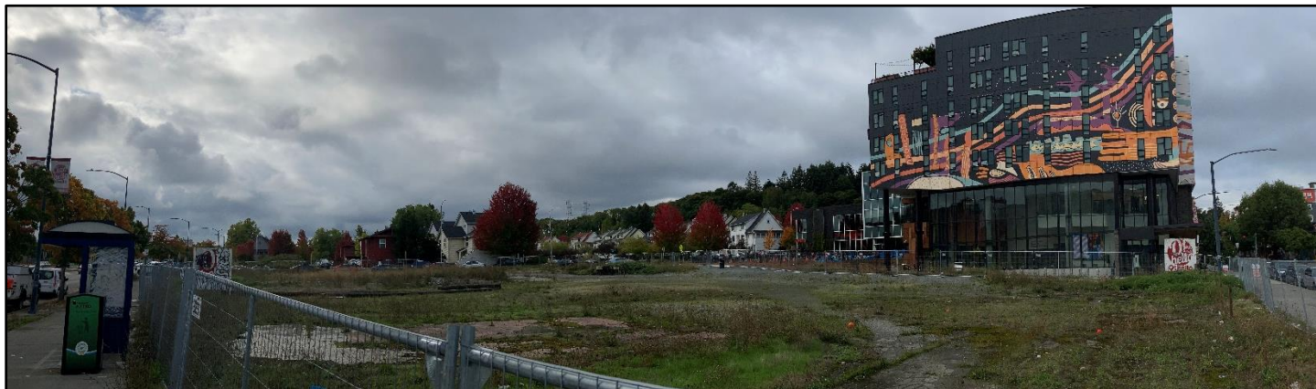
Địa Điểm Cần Dọn Dẹp Holly Park