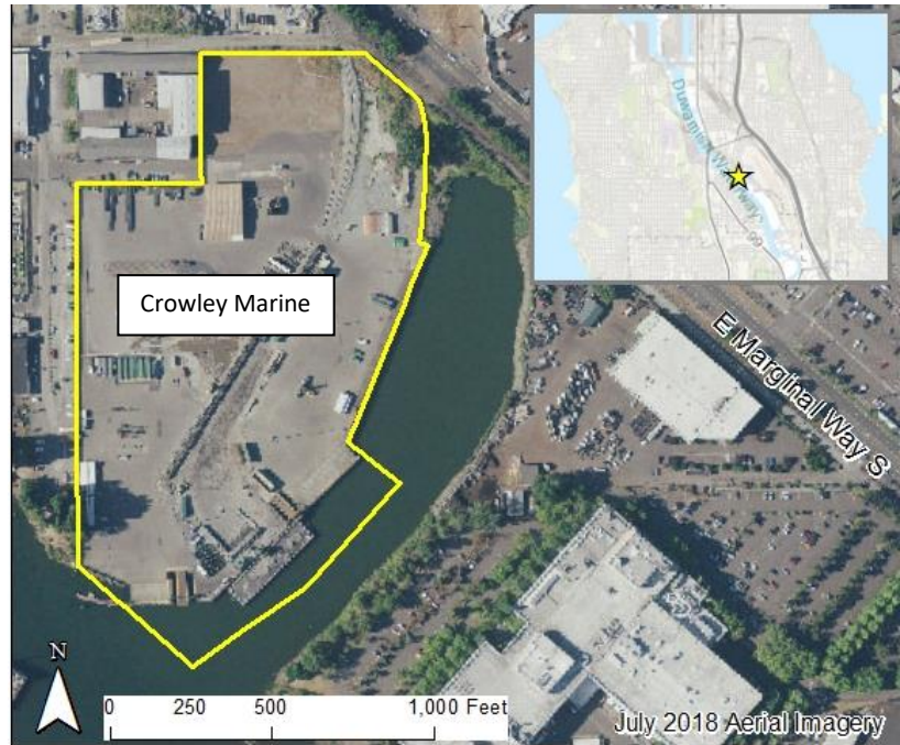
Imagen 1: Vista aérea del sitio de limpieza de Crowley Marine.

Crowley Marine está situado en una zona industrial del sur de Seattle, en la orilla este del río Lower Duwamish Waterway (LDW). El sitio de limpieza comprende aproximadamente 16 acres de propiedad industrial frente al mar. Antes del enderezamiento y canalización del río Duwamish a principios de 1900 para convertirse en el río actual, el sitio era un terreno agrícola y un pastizal de campo abierto. Desde entonces, la zona se ha utilizado para diversas actividades industriales y de fabricación, como aserraderos y fabricación de tuberías y cadenas. La parte sureste del sitio incluye el canal antiguo del río Duwamish, que más tarde se convirtió en Slip 4.