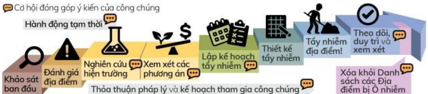
Hình 3: Quy trình dọn sạch chính thức của Washington

Đạo Luật Kiểm Soát Chất Độc Mẫu (Model Toxics Control Act, MTCA 4 ) là luật dọn sạch môi trường của Washington. Đạo luật này đưa ra các yêu cầu về việc dọn sạch địa điểm bị ô nhiễm và đặt ra những tiêu chuẩn bảo vệ sức khỏe con người và môi trường. Ecology chịu trách nhiệm thi hành MTCA, bao gồm cả việc giám sát công tác dọn sạch. Quy trình dọn sạch theo MTCA 5 được hoàn thành theo từng bước (xem hình bên dưới) theo dòng thời gian có thể thay đổi.