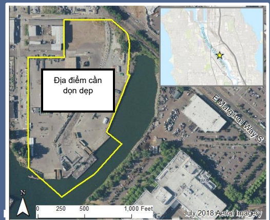
Bản đồ nhìn từ trên không của địa điểm cần dọn sạch Crowley Marine.