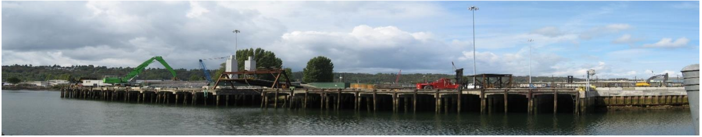
Hình 2: Khung cảnh Crowley Marine nhìn từ phía tây nam