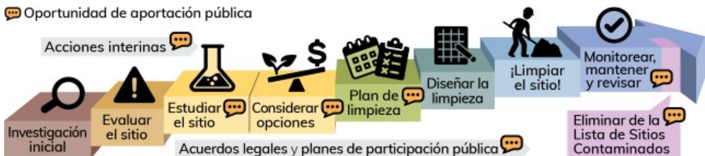
Figura 1. Los pasos en el proceso formal de limpieza de Washington.