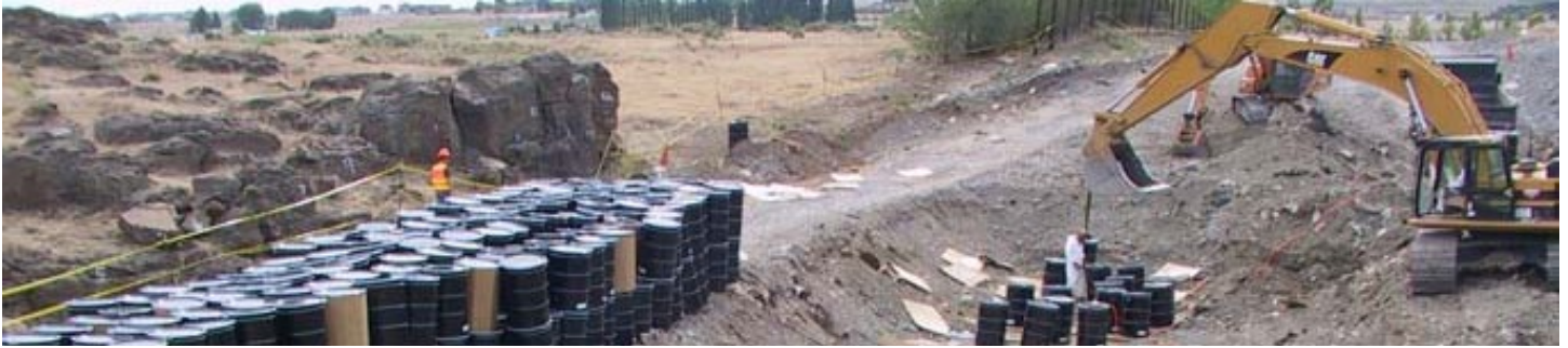
Bidones de residuos industriales se extrajeron y eliminaron apropiadamente del sitio en el 2008.