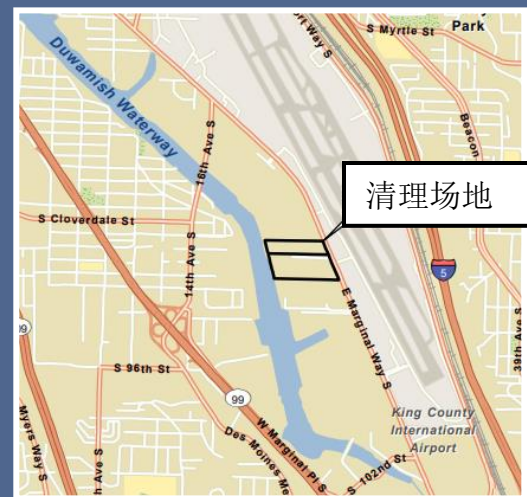
Boeing Isaacson Thompson 清理场地航拍图。

如需申请《美国残疾人法案》(Americans with Disabilities Act, ADA) 特殊照顾，请致电 425-229-3683 联系 Ecology，或发送电子邮件至 LDW@ecy.wa.gov ，或访问网站 ecology.wa.gov/Accessibility 。 中继服务或听障专线 (TTY)，请拨打 711 或 877-833-6341。