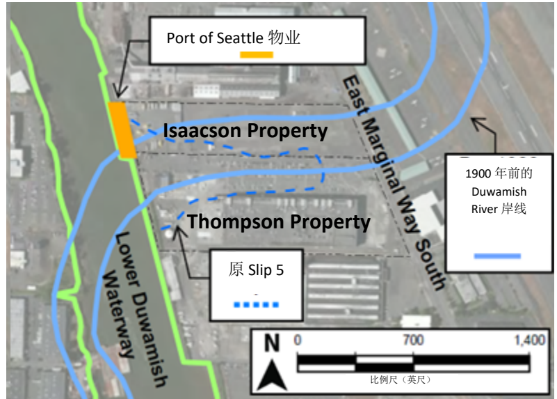
场地与 Duwamish River 历史及现行水道航拍图。

Boeing Isaacson Thompson 清理地点位于 Tukwila 工业区的 Lower Duwamish Waterway (LDW) 东岸。该清理场地由 The Boeing Company 拥有的两块物业和 Port of Seattle 拥有的一块物业组成。该区域原本是潮汐湿地。20 世纪初, Duwamish River 被整治和疏浚, 形成了如今的 Duwamish Waterway, 并进行了填海造地。疏浚后, 该区域最初被用作农田, 随后转变为多种工业用途。位于场地中央的原 Duwamish River 河道 (后称为 Slip 5) 逐渐被来源不明的污染物所填充。