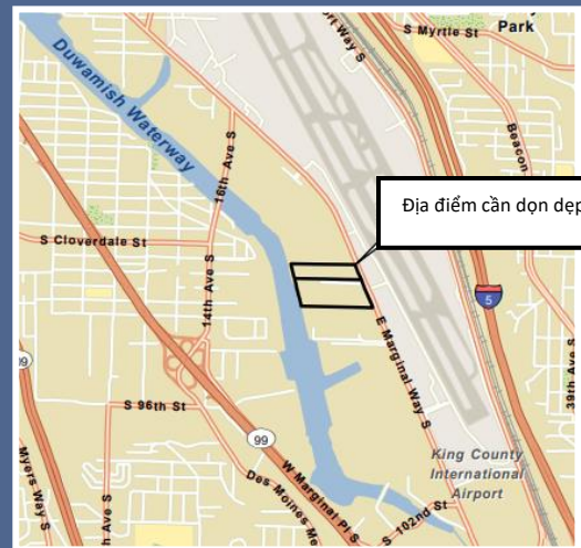
Bản đồ địa điểm cần dọn dẹp Boeing Isaacson Thompson nhìn từ trên không.

Để yêu cầu sắp xếp theo ADA (Đạo Luật Người Khuyết Tật Hoa Kỳ (Americans with Disabilities Act, ADA)), hãy liên hệ với Ecology qua số điện thoại 425-229-3683, địa chỉ email LDW@ecy.wa.gov hoặc trang web ecology.wa.gov/Accessibility . Đối với Dịch Vụ Chuyển Tiếp hoặc Tiếp Âm (TTY), hãy gọi 711 hoặc 877-833-6341.