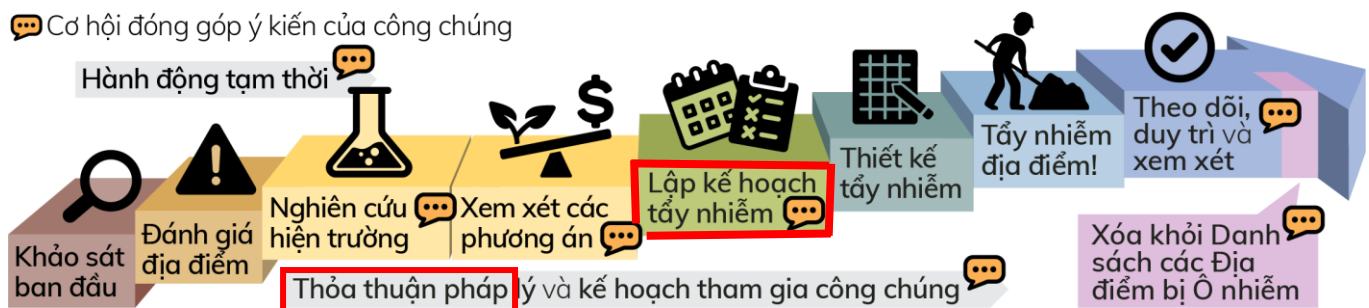
Quy trình dọn dẹp chính thức của Washington

Mỗi tài liệu cần xem xét cho Địa Điểm này đều được trình bày dưới đây bằng màu đỏ.