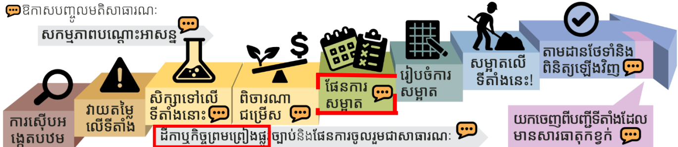
ដំណើរការសម្អាតផ្លូវការរបស់រដ្ឋ Washington

ឯកសារពិនិត្យឡើងវិញរបស់ទីតាំងនេះត្រូវបានរៀបរាប់ខាងក្រោមដោយពណ៌ក្រហម។