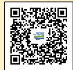
ស្វែងរកដើម្បីទទួលបានព័ត៌មានចុងក្រោយបំផុតអំពីព័ត៌មាន ផ្លូវទឹក Lower Duwamish Waterway

មកផ្ទាល់៖ Duwamish River Community Hub 8600 14 th Ave. South Seattle, WA 98108