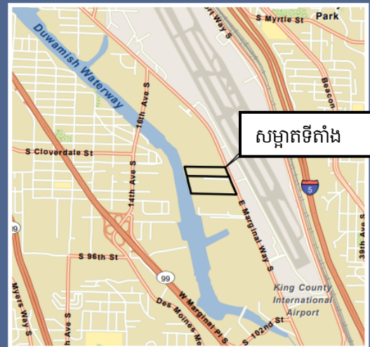
ផែនទីពីលើអាកាសរបស់ក្រុមហ៊ុន Boeing Isaacson ទីតាំងសម្អាត Thompson ។

សម្រាប់សេវាបញ្ជូនបន្ត ឬ TTY សូមទូរសព្ទទៅលេខ 711 ឬ 877-833-6341 ។